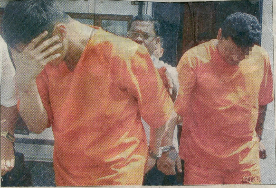
கைது செய்யப்பட்ட ஆடவர்கள் நீதிமன்ற ஆணைக்கு பின் போலீஸ் வேனில் ஏற்றப்பட்ட போது.