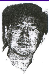
■鄭可揚：近期內可獲解決。

仍清楚的聽到所播放的音樂及DJ的聲音，令她無法入睡。她表示，她雖已退休，但家中還有要上學及上班的孩子，使他們的生活受到干擾。 鄭女士投訴說，由於最近這兩個月來，不斷在凌晨時分受到強勁的音樂影響，已使她不能好好入睡，如今更導致她頭痛及精神不振。 另一名居民蘇先生說，音樂帶來的噪音，使當地居民在約兩個月來深受影響。其住家就在近打城附近，每天都受到該化糞池發出的臭氣「虐待」，如今都已快有四年時間了，惟怡保市政廳到目前尚未能為居民解決問題。 他對當局的處事態度感到十分的失望。 據悉，該區約四十名居民於上個星期原本已約見市長，但由於市長有事在身，而未克出席，因此把約見的日期再展至今日，無奈適逢今日市長又因有重要事件而未能如期會見市民。